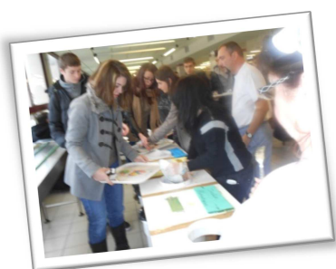
Merci pour votre compréhension et votre aide

Autre réflexion : en 5 jours de fonctionnement, nous avons produit : 534 kilos de déchets alimentaires soit en 175 jours de fonctionnement du restaurant scolaire 18.7 tonnes