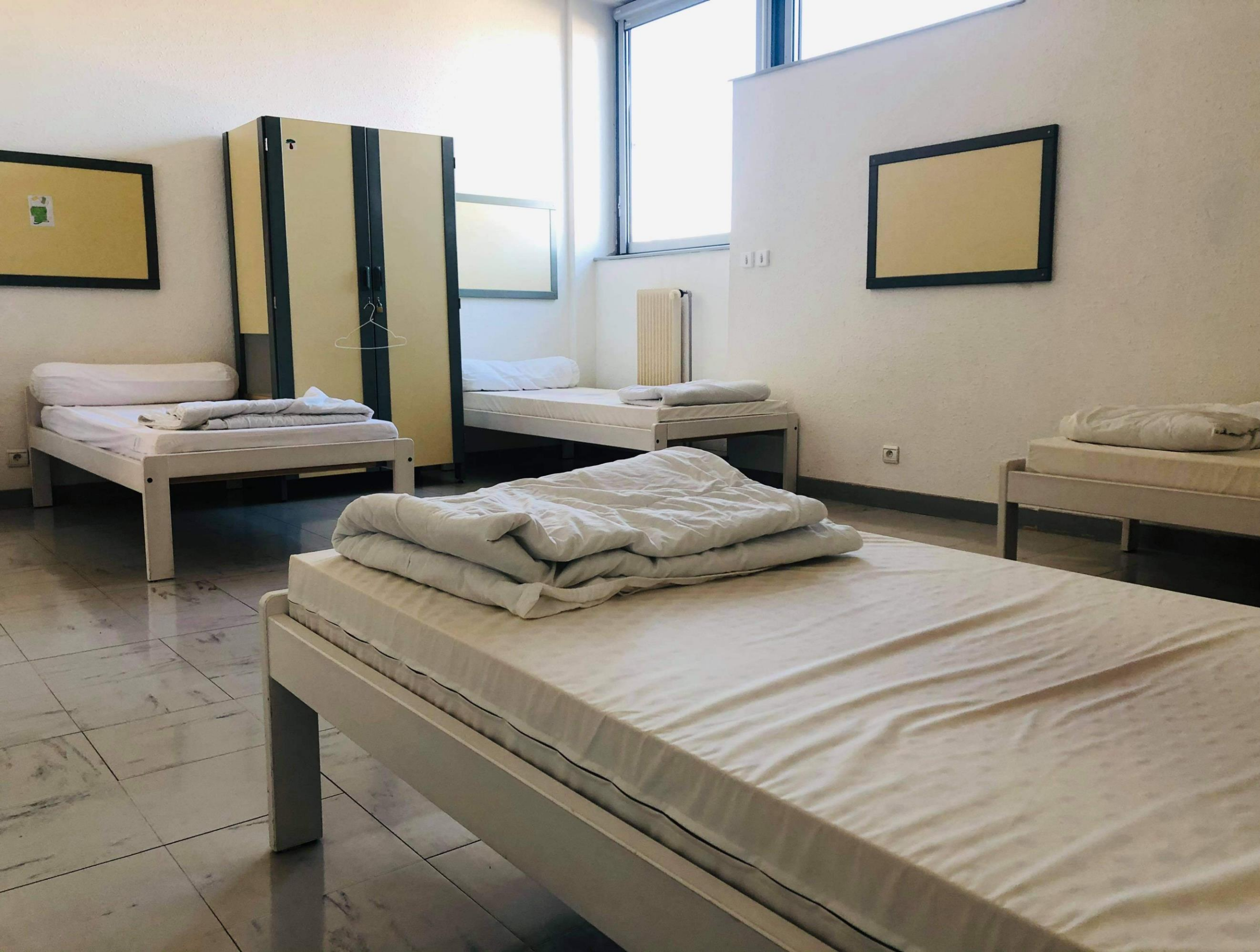
Chambre garçon (dortoir 2)