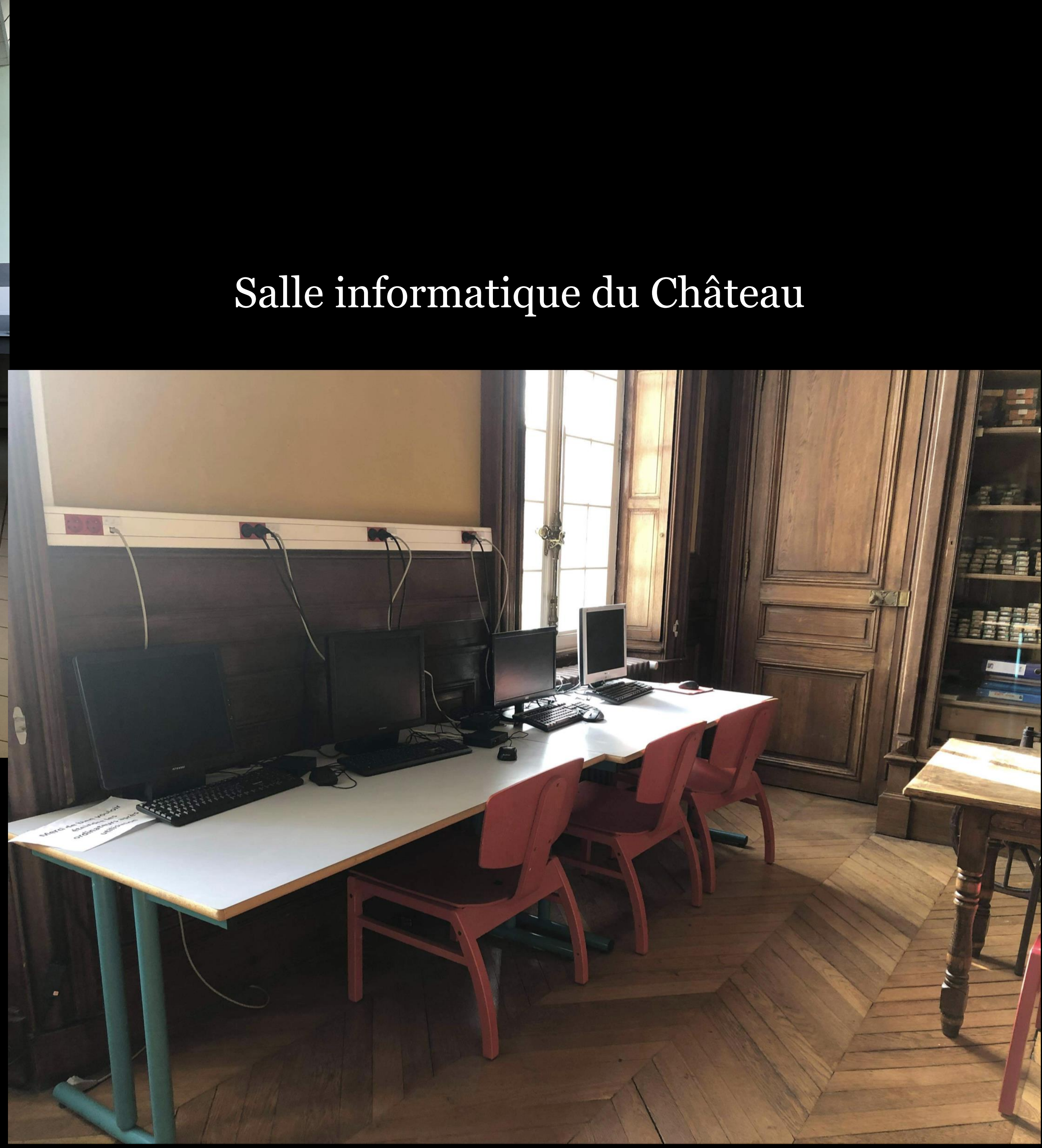
Salle informatique du Château