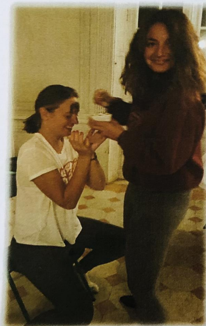
Et un atelier soins pour le visage à base de produits naturels (œuf, yaourt, miel, huile d'olive, avoine...) préparé par les filles

Soirée parfaite A refaire très vite Cela magnifique soirée !! à refaire à chaque vacances Chaline