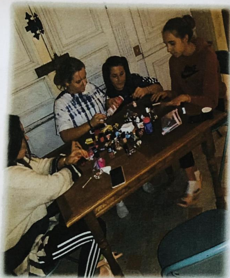
Pose de vernis

une super soirée super ambiance, à refaire vite Salooomé