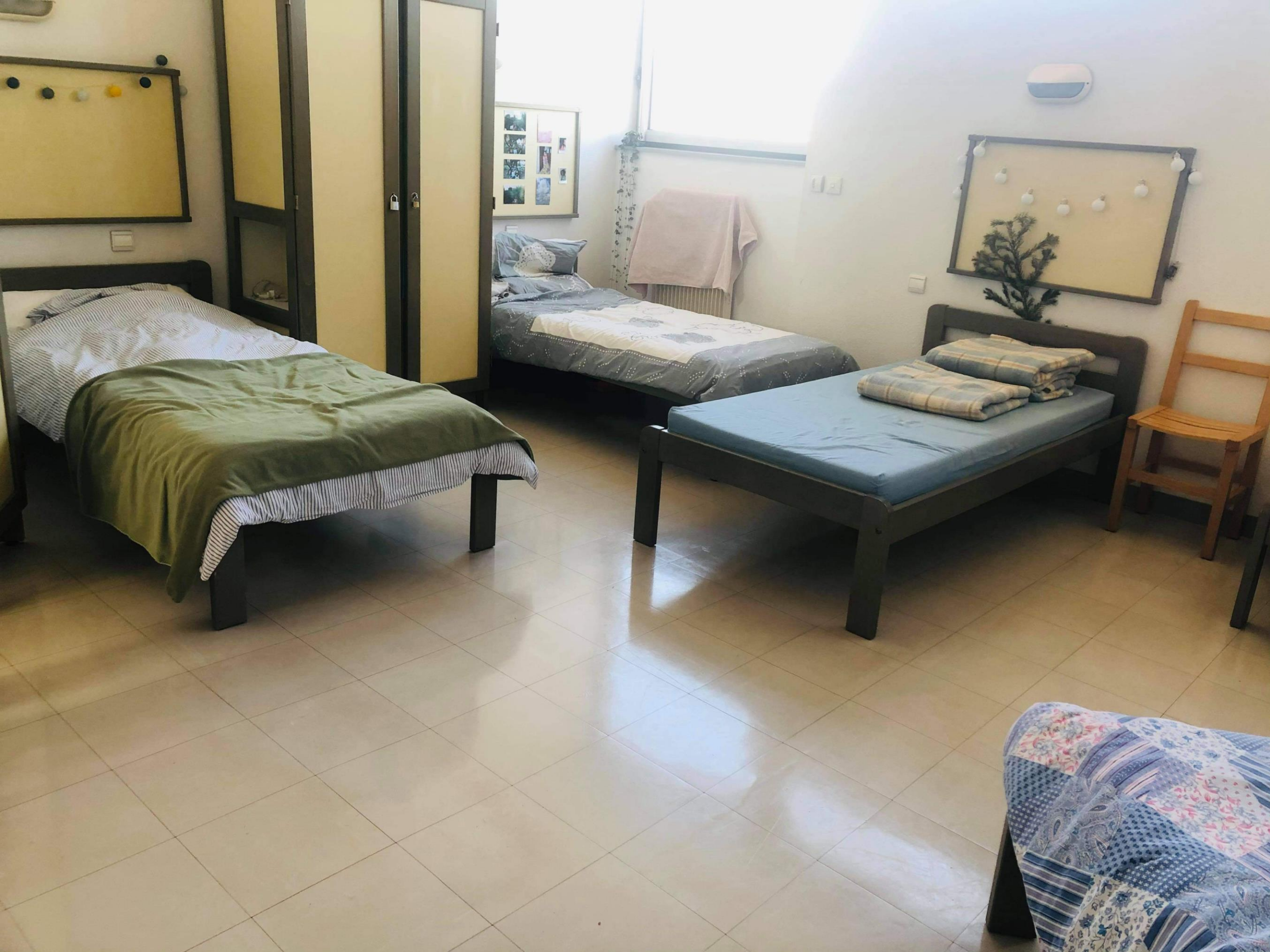
Salle de détente (dortoir 4)