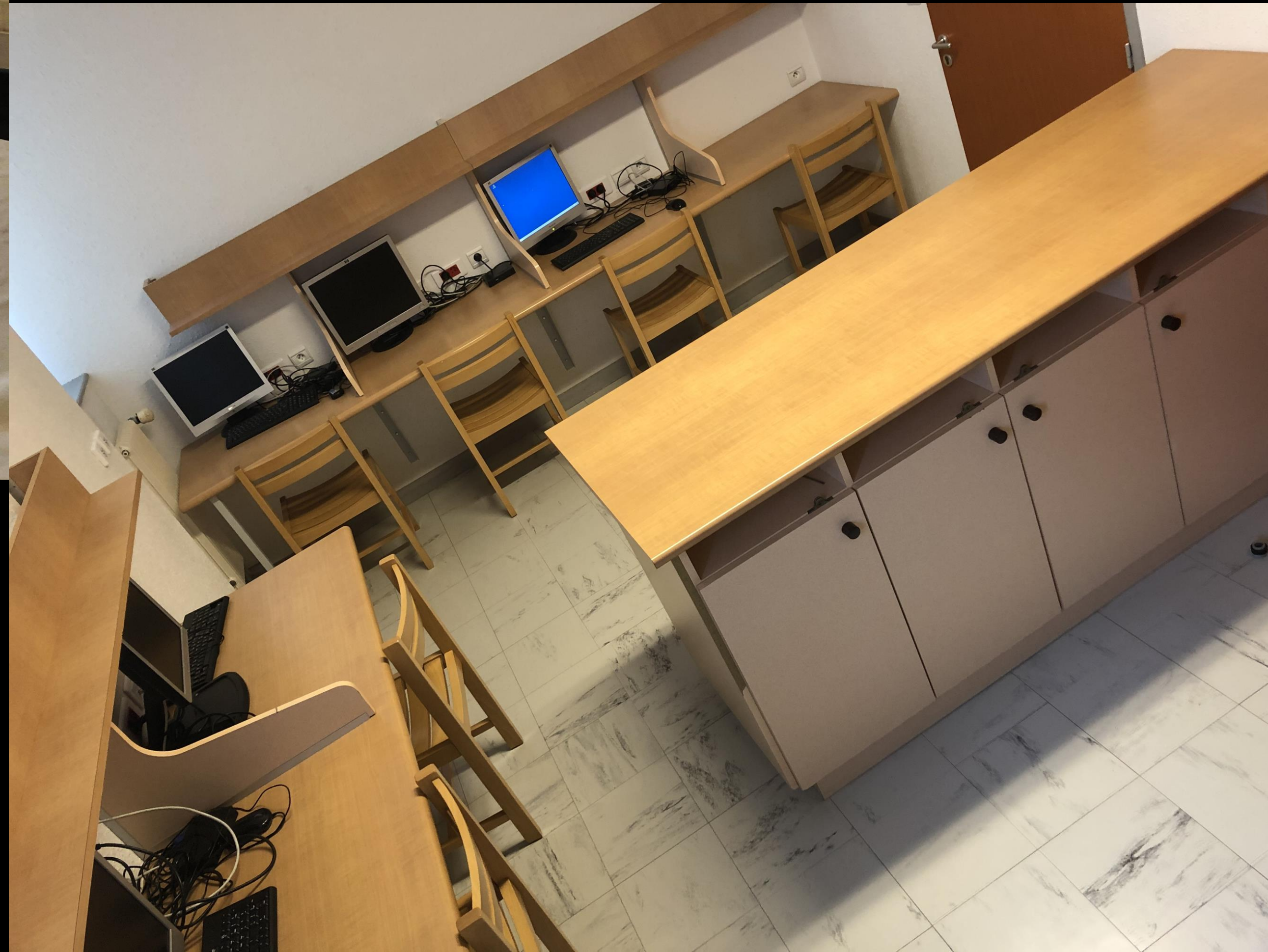
Salle de travail (dortoir 2)