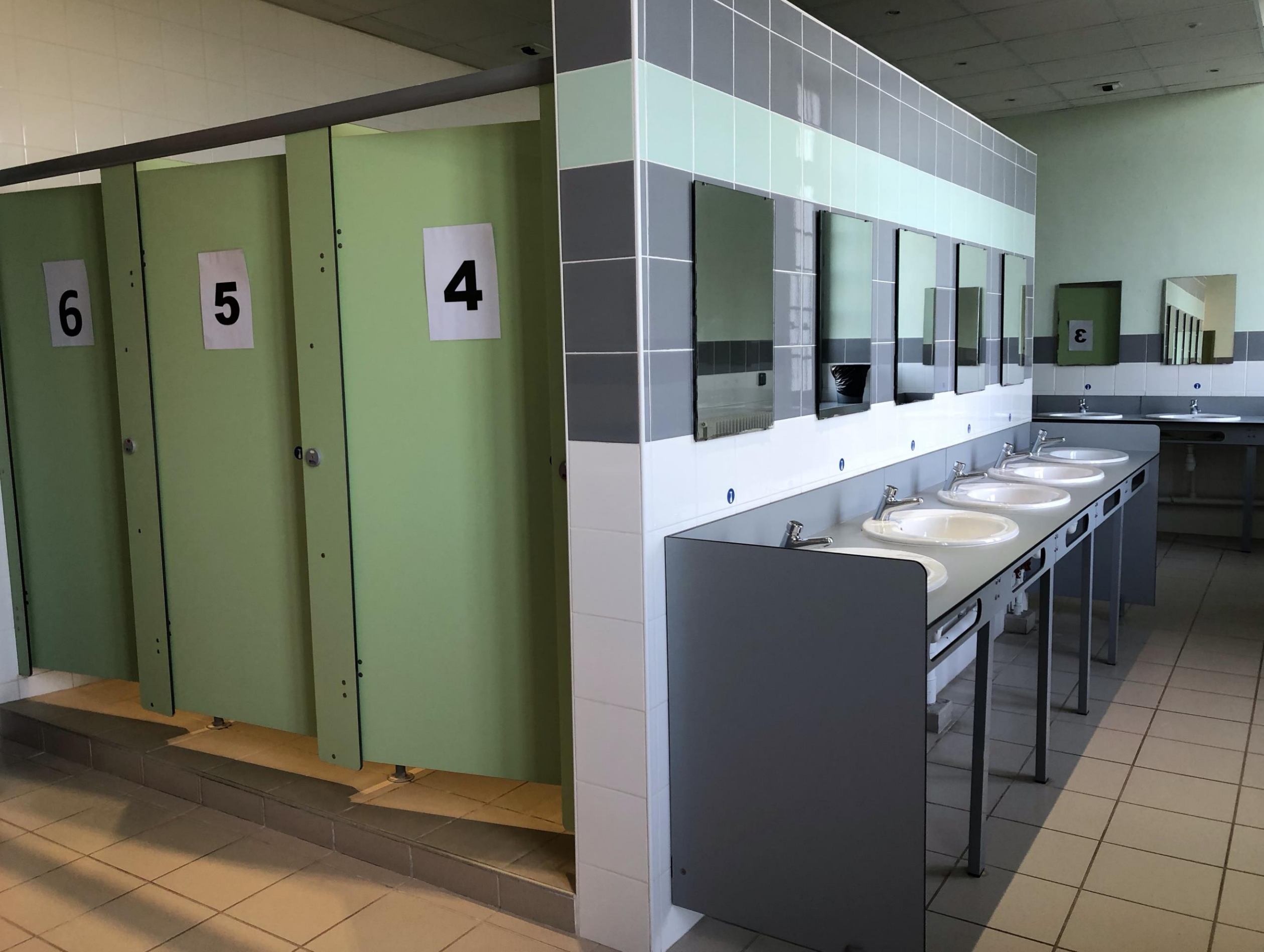
Douches du Château